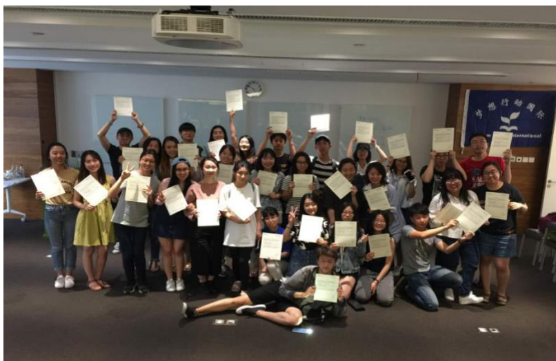
( 图为北京培训合影 )