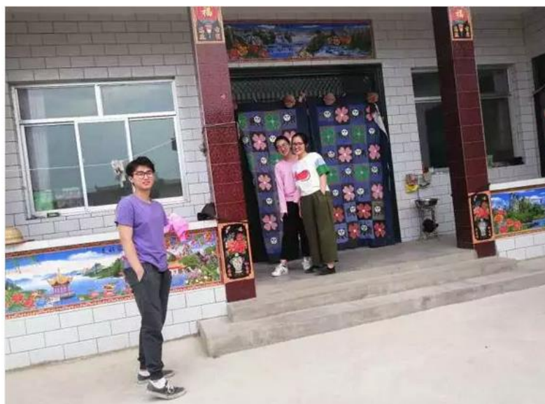
( 志愿者准备进入当地家庭家访 )

使有书，每天腾出 20 分钟的时间和孩子一起读书只能是个奢望。这让我更感到乡村学校图书室的重要性：父母无法给予的那部分，需要学校，阅览室来帮忙完成。”