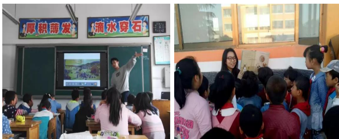
( 图为志愿者们在上阅读课 )

志愿者在项目点的另一项很重要的工作是开展阅读课和包括故事会，朗诵，歌咏，游戏，戏剧等各种形式的阅读活动。志愿者们用不同的形式的活动引导孩子们阅读。通过阅读为孩子们带来新的知识，感受到阅读的快乐，为他们打开新的世界。这些生动的阅读活动，都深受学生们的喜爱。