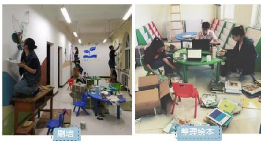
(图为 18 年)

作为第一年的项目点，我们的一个重要任务就是把图书室建起来。第一年的志愿者都会面对的是一间空空如也的房间，所有设计与装饰的工作都要在有限的预算里自己完成。根据图书室针对的不同年龄段的儿童，我们的志愿者发挥他们的创造力：粉刷墙壁并对墙壁进行墙绘：比如设立在幼儿园里的图书室，志愿者们会绘上卡通图案。除了这些美丽的绘画，我们的志愿者还会在墙上画上梦想行动的图标。